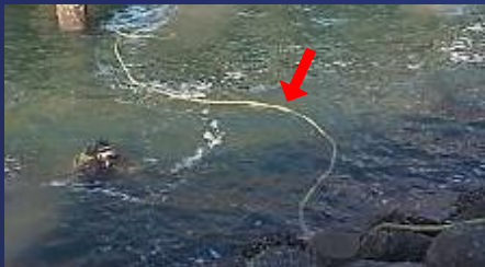
潜水士用の操作線ケーブル