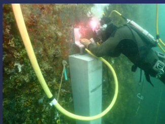
水中溶接作業の様子